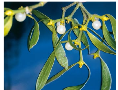
Abb. 3: Misteln enthalten unter anderem Mistel-Lektin I, das als wirksame Leitsubstanz in pflanzlichen Arzneimitteln dient.

Die vorgestellte Methode eignet sich nicht nur für die quantitative Analyse von proteinhaltigen Pflanzenextrakten. Auch für die Entwicklung und klinische Prüfung von Biopharmazeutika ist die Massenspektrometrie eine Methode mit Potenzial. So lässt sie zum Beispiel Aussagen zur Pharmakokinetik von proteinischen Wirkstoffen zu. Sie kann die Konzentration von Biopharmazeutika, Biosimilars und deren Abbauprodukten im Blut zuverlässig und mit hoher Empfindlichkeit analysieren. In der biotechnologischen Produktion kann das Verfahren eingesetzt werden, um